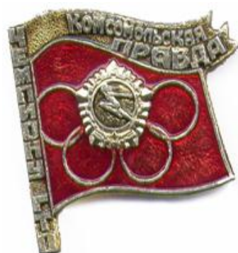
Значок «Чемпиону ГТО», Алма-Ата, 1979 год