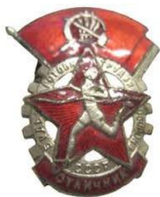
Значок ГТО 1 ступени