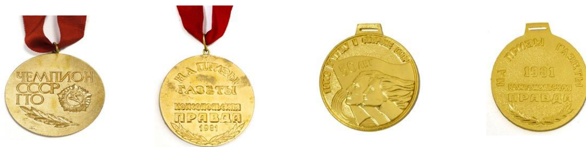
Значок и медали чемпионата СССР по многоборью комплекса ГТО на призы газеты «Комсомольская правда», Кишинёв, 1981 год