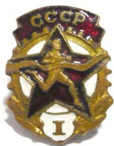
Значки «Будь готов к труду и обороне»