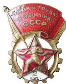
Значки ГТО I и 2 ступеней 1946 – 1961 годов