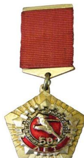
Знак «50 лет комплексу ГТО»