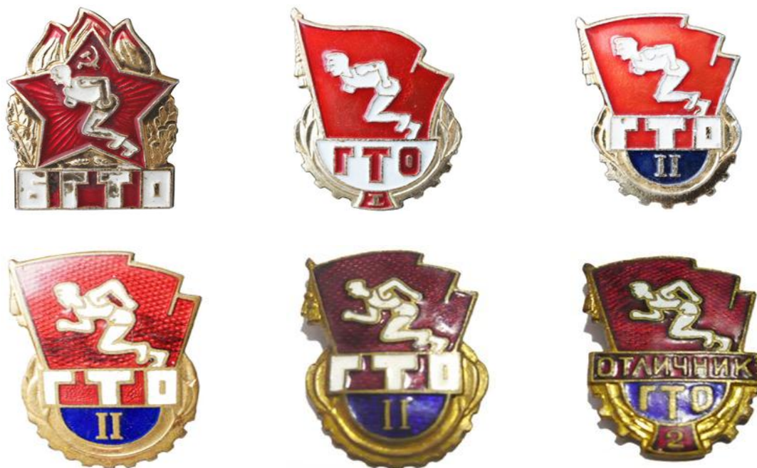
Значки БГТО и ГТО 1961 года

Обновленный Комплекс ГТО состоял из трех ступеней. Ступень БГТО - для школьников 14 - 15 лет, ГТО 1-й ступени - для юношей и девушек 16-18 лет, ГТО 2-й ступени - для молодежи 19 лет и старше.