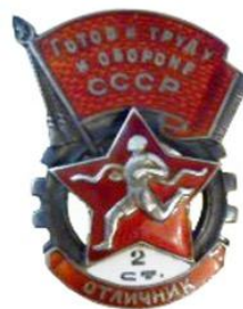
Значки «Отличник ГТО» 2 ступени 1940-1946 годов (серебро и бронза)