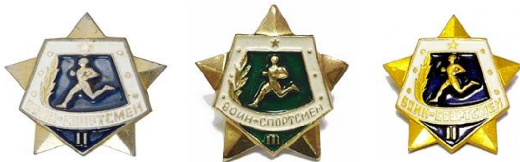
Значки «Воин-спортсмен» I, II и III ступеней, 1961 год