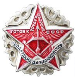
Значок региональных соревнований ГТО – Спартакиада народов СССР»