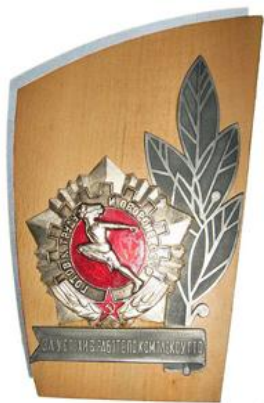
Знак «За успехи в работе по комплексу ГТО»