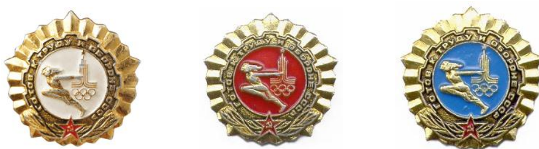
В 1980 году была выпущена специальная серия значков ГТО, посвящённая Играм XXII Олимпиады в Москве