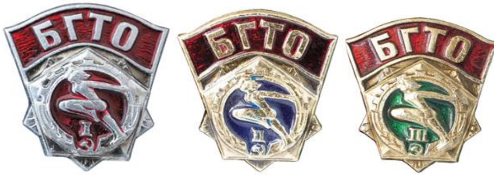
Значки БГТО I, II, III ступеней выпуска 1972 года