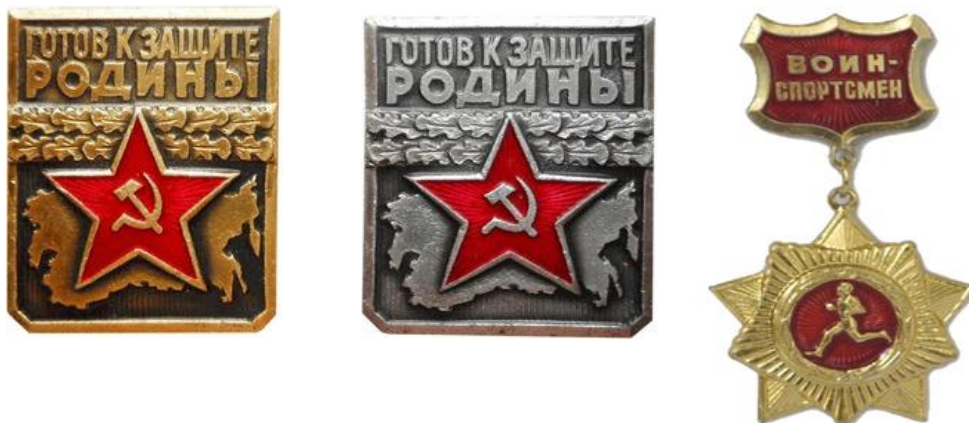
Золотой нагрудный знак «Воин-спортсмен», 1961 год

В 1966 году по инициативе ДОСААФ была разработана и введена в действие ступень комплекса ГТО для молодежи призывного возраста «Готов к защите Родины» (ГЗР).